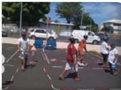
La théorie suivie de la pratique