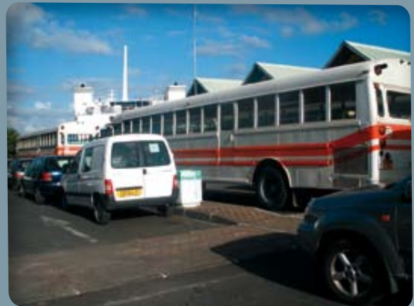
Port de Vaiare, passage obligé des bus

La direction des transports terrestres apportera ainsi son concours technique à ce projet par des études préalables pour déterminer les besoins en lignes régulières et scolaires ainsi que le nombre d'abris bus nécessaires sur l'île de Moorea, avec la constitution et le suivi du dossier d'appel d'offres qui en découlera.